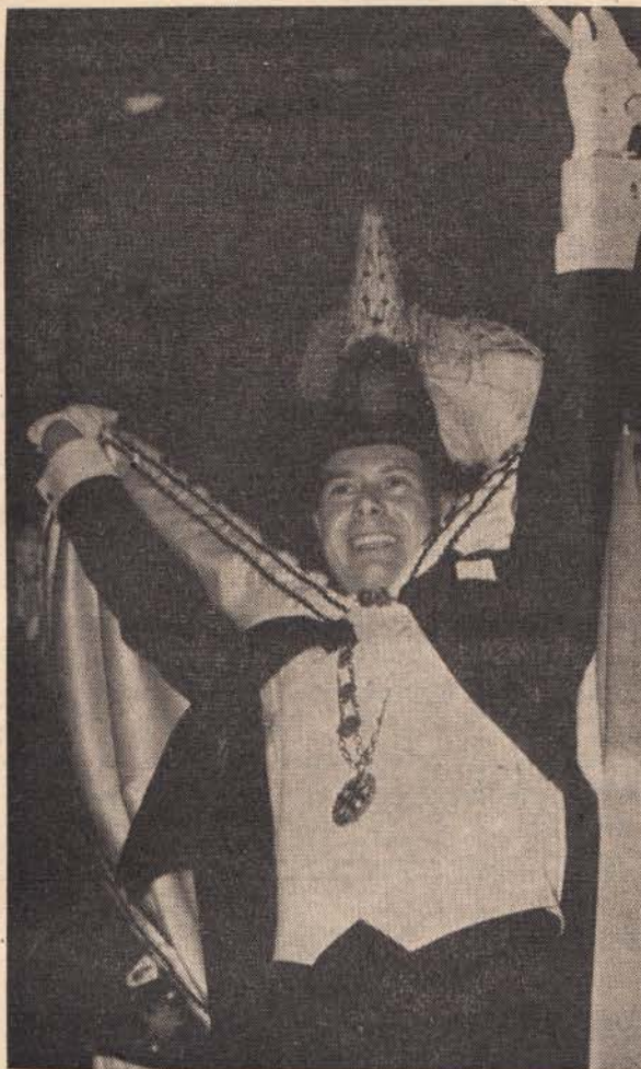
PRINS OLLIE I

RIJSSEN. - Het monumentale gebouw de Oosterhof te Rijssen, voorkomend op de lijst van monumentenzorg en eigendom van de gemeente aldaar, is in de maand december ontluisterd door de sloop van het bij dit complex behorende oostelijk bouwhuis. Evenals het reeds in 1334 genoemde hoofdgebouw verkeerde ook dit bijgebouw in een desolate toestand Doordat de eigenaresse geen maatregelen trof, stortte een deel van de achterzijde van het enig overgebleven bouwhuis in (het westelijk bouwhuis werd in 1820 afgebroken), waarop de gemeente Rijssen het bijgebouw onmiddellijk met de grond gelijk liet maken. Ofschoon van gemeentezijde in Rijssen beweerd wordt, dat men voor deze afbraak mondeling toestemming heeft gekregen, wordt een vergunning tot afbraak door de betrokken instanties ontkend. Drs. A. L. Hulshoff van het Rijksmuseum Twenthe deelde ons desgevraagd mee de afbraak zeer te betreuren, vooral nu deze te prematuur heeft plaatsgevonden.